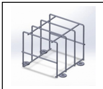
Grille de protection Capteur Hytronik HIM84 RAL 9003 (80001265)

Date de création de la carte: 15 octobre 2024