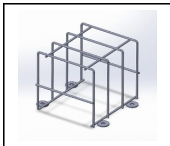
Grille de protection Capteur Hytronik HIM84 RAL 9003 (598913)

Date de création de la carte: 03 octobre 2025