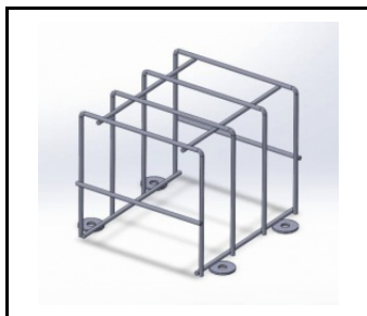
Grille de protection Capteur Hytronik HIM84 RAL 9003 (598913)

Date de création de la carte: 04 novembre 2025