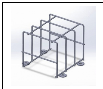
Schutzgitter Sensor Hytronik HIM84 RAL 9003 (598913)

Erstellungsdatum der Karte: 03 October 2025