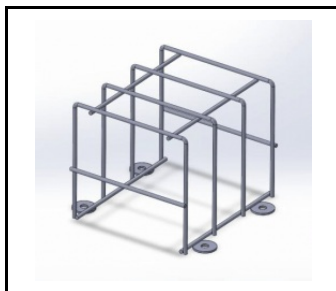
Schutzgitter Sensor Hytronik HIM84 RAL 9003 (598913)

Erstellungsdatum der Karte: 03 October 2025