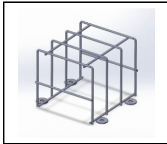
Schutzgitter Sensor Hytronik HIM84 RAL 9003 (598913)

Erstellungsdatum der Karte: 03 October 2025