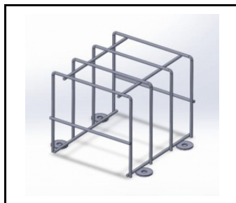
Siatka ochronna Czujnik Hytronik HIM84 RAL 9003 (80001265)