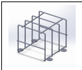
Siatka ochronna Czujnik Hytronik HIM84 RAL 9003 (598913)

Data utworzenia karty: 03 październik 2025