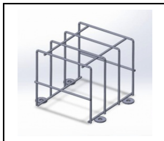
Siatka ochronna Czujnik Hytronik HIM84 RAL 9003 (598913)