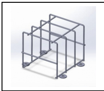
Siatka ochronna Czujnik Hytronik HIM84 RAL 9003 (598913)

Data utworzenia karty: 03 październik 2025