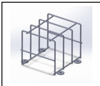
Siatka ochronna Czujnik Hytronik HIM84 RAL 9003 (80001265)