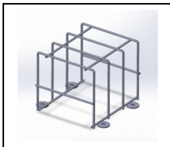
Siatka ochronna Czujnik Hytronik HIM84 RAL 9003 (598913)