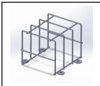
Ochranná mřížka Senzor Hytronik HIM84 RAL 9003 (598913)