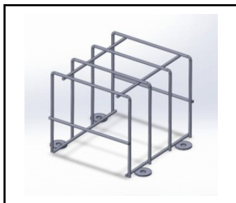
Grille de protection Capteur Hytronik HIM84 RAL 9003 (80001265)

Date de création de la carte: 15 octobre 2024