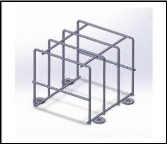
Grille de protection Capteur Hytronik HIM84 RAL 9003 (598913)

Date de création de la carte: 03 octobre 2025 Le fabricant se réserve le droit d'apporter des modifications au cours de l'amélioration du produit ainsi que des modifications de conception ou de modernisation du produit présenté. La fiche technique du produit n'est pas une offre commerciale * La tolérance des paramètres est de +/- 10 %