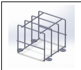
Schutzgitter Sensor Hytronik HIM84 RAL 9003 (80001265)

Erstellungsdatum der Karte: 15 October 2024