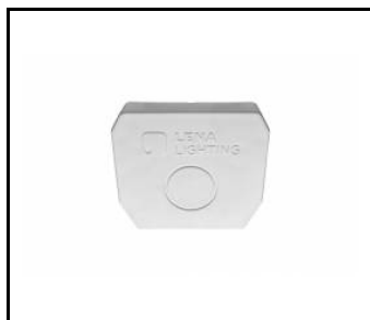
LINEA S LED – koncovka IP40 nástrčná (980060)