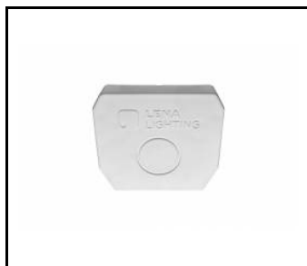
LINEA S LED zakończenie IP40 (980060)