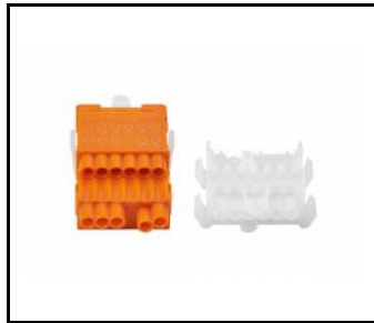
LINEA S LED – Endkappe IP40 steckbar (980060)