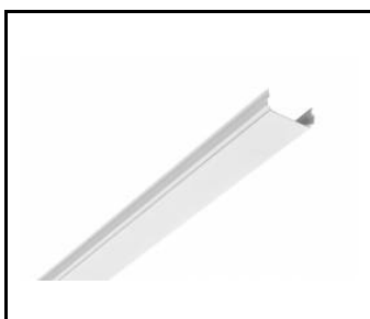
LINEA S LED zakończenie IP40 (980060)