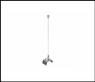
LINEA S LED pendentif 1.5m (981173)