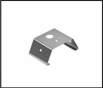
Support de montage en surface Linea S LED (980954)