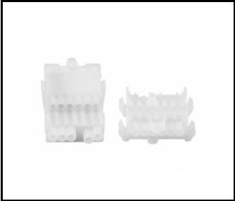
LINEA S Bloc d'alimentation LED 5P (980084)