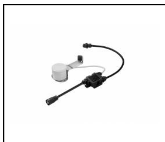
OCULUS LED - czujnik RCR i zmierzchowy (964244)