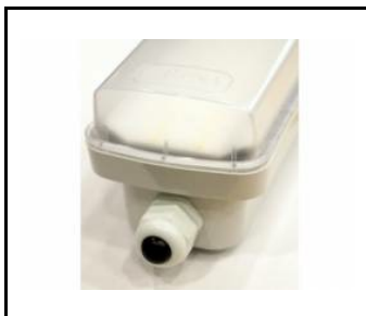
Bouchon presse-étoupe M16. divers PA noir M-16 - BPM-21 (60000006)

Date de création de la carte: 20 juin 2024