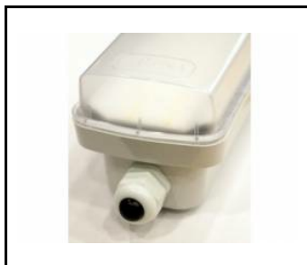
Bouchon presse-étoupe M16. divers PA noir M-16 - BPM-21 (60000006)

Date de création de la carte: 20 juin 2024