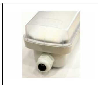
Bouchon presse-étoupe M16. divers PA noir M-16 - BPM-21 (60000006)

Date de création de la carte: 20 juin 2024