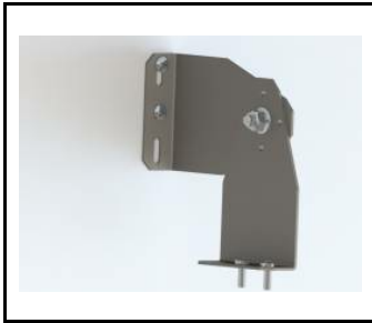
Halterung - TYTAN LED. INDUSTRY LED KOMPLET (2st.) (908200)