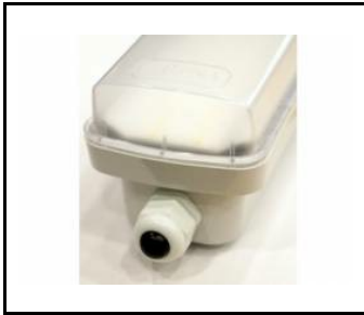
Blindstopfen für M16-Kabelverschraubung verschiedene PA schwarz M-16 – BPM-21 (60000006)

Erstellungsdatum der Karte: 20 Juni 2024