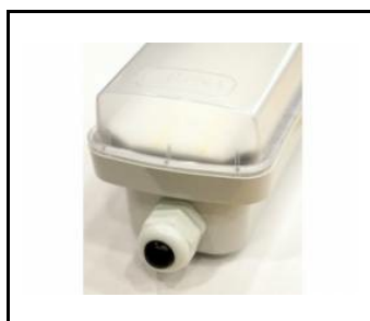
Zaślepka dławnicy M16 różne PA czarna M-16 - BPM-21 (60000006)