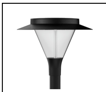
SKVER Hood příklad 1 RAL9005 (435522)