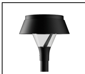
SKVER Hood ULR příklad 2 RAL9005 (421518)