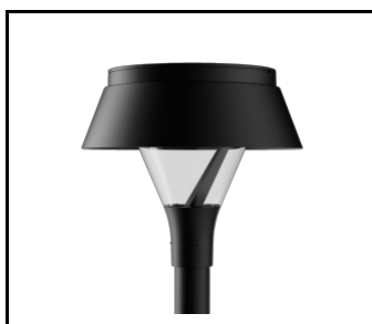
SKVER Hood ULR příklad 2 RAL9005 (421518)