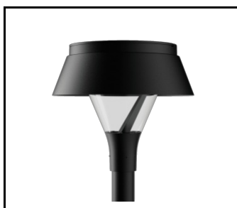
SKVER Hood ULR příklad 2 RAL9005 (421518)