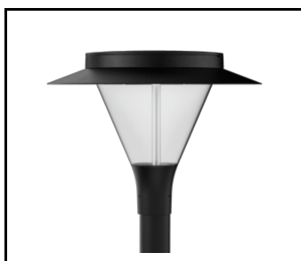
SKVER Hood příklad 1 RAL9005 (435522)