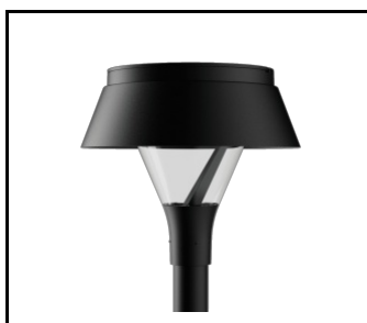
SKVER Hood ULR příklad 2 RAL9005 (421518)