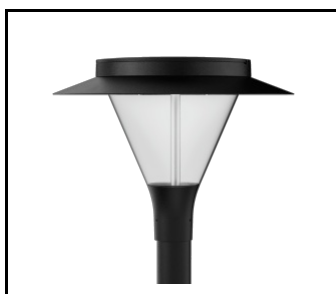
SKVER Hood příklad 1 RAL9005 (435522)