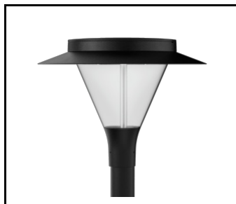
SKVER Hood příklad 1 RAL9005 (435522)