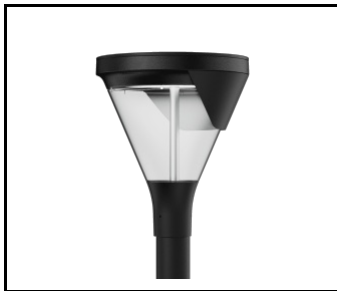
SKVER Backshield RAL9005 (435515)