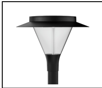
SKVER Hood příklad 1 RAL9005 (435522)