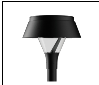
SKVER Hood ULR příklad 2 RAL9005 (421518)