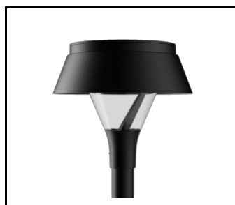
SKVER Hood ULR příklad 2 RAL9005 (421518)