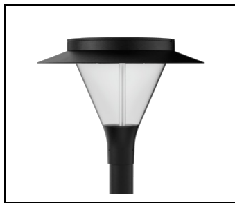
SKVER Hood příklad 1 RAL9005 (435522)