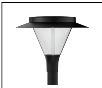
SKVER Hood příklad 1 RAL9005 (435522)