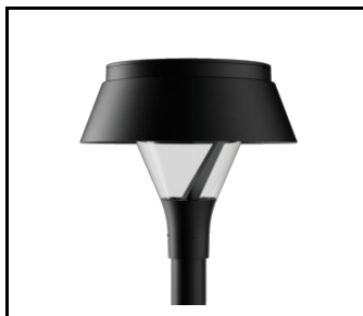
SKVER Hood ULR příklad 2 RAL9005 (421518)