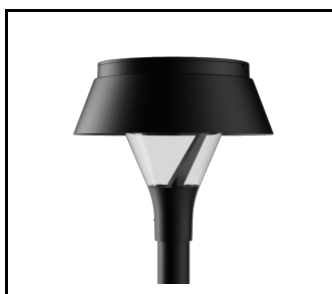
SKVER Hood ULR příklad 2 RAL9005 (421518)