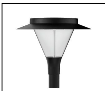
SKVER Hood příklad 1 RAL9005 (435522)