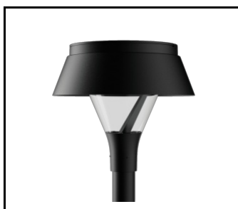
SKVER auvent ULR modèle 2 RAL9005 (421518)

Date de création de la carte: 21 octobre 2024