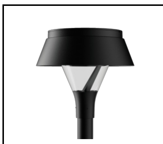
SKVER auvent ULR modèle 2 RAL9005 (421518)

Date de création de la carte: 21 octobre 2024