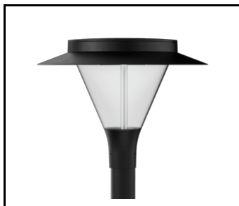
SKVER auvent. modèle 1 RAL9005 (435522)

Date de création de la carte: 21 octobre 2024