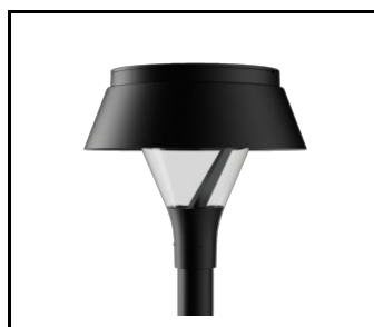
SKVER auvent ULR modèle 2 RAL9005 (421518)

Date de création de la carte: 21 octobre 2024