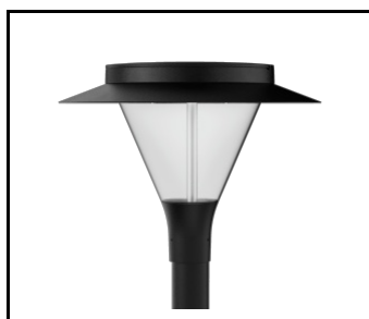
SKVER auvent. modèle 1 RAL9005 (435522)