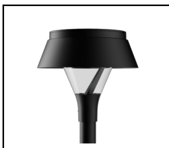
SKVER auvent ULR modèle 2 RAL9005 (421518)

Date de création de la carte: 21 octobre 2024