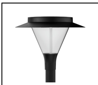
SKVER auvent. modèle 1 RAL9005 (435522)