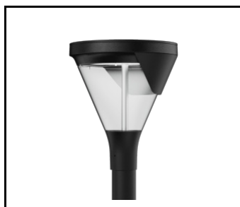
SKVER Backshield RAL9005 (435515)