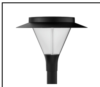
SKVER Reflektor Muster 1 RAL9005 (435522)

Erstellungsdatum der Karte: 21 October 2024