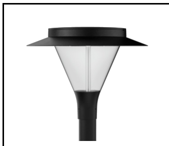
SKVER Reflektor Muster 1 RAL9005 (435522)