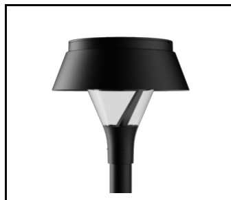
SKVER Reflektor ULR Muster 2 RAL9005 (421518)

Erstellungsdatum der Karte: 21 October 2024