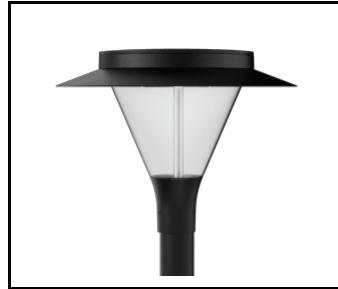
SKVER Reflektor Muster 1 RAL9005 (435522)

Erstellungsdatum der Karte: 21 October 2024