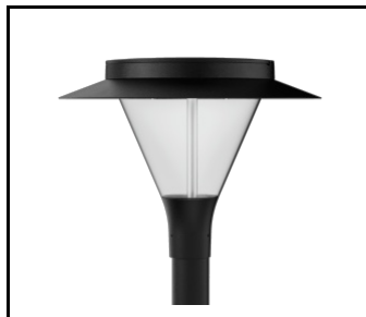
SKVER Reflektor Muster 1 RAL9005 (435522)