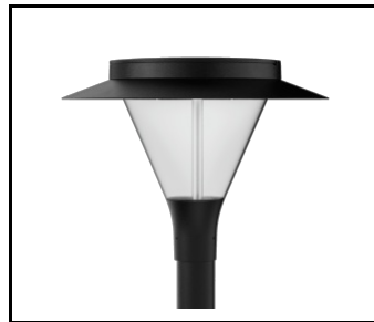
SKVER Reflektor Muster 1 RAL9005 (435522)