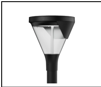
SKVER Backshield RAL9005 (435515)