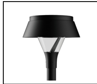
SKVER Reflektor ULR Muster 2 RAL9005 (421518)

Erstellungsdatum der Karte: 21 October 2024