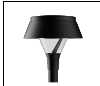
SKVER Reflektor ULR Muster 2 RAL9005 (421518)

Erstellungsdatum der Karte: 21 October 2024